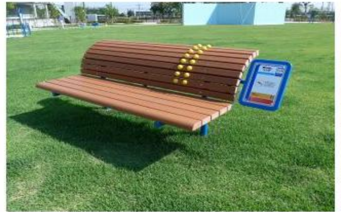
ストレッチベンチ