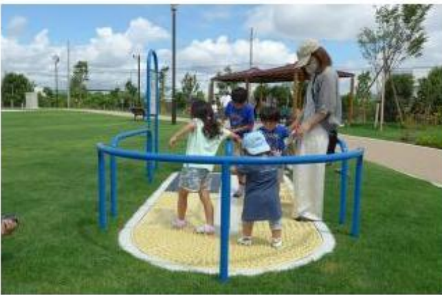
足つぼマッサージ