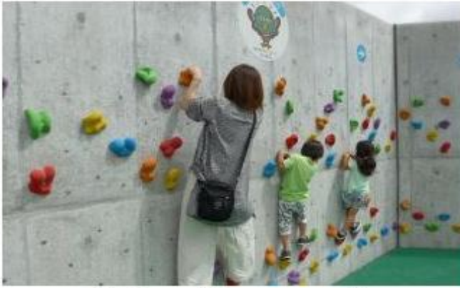
ボルダリング（たみまるの壁）