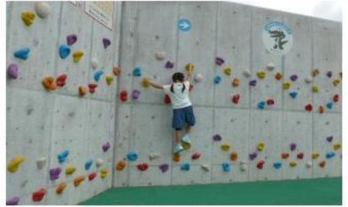
ボルダリング（マチカネくんの壁）